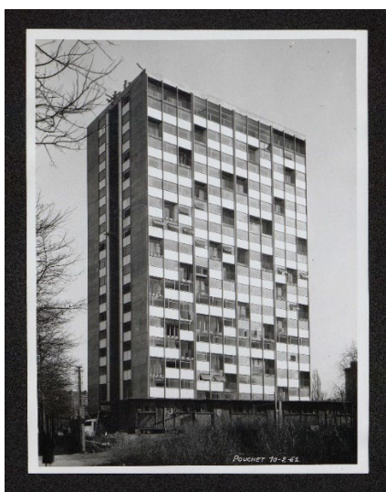
Tour du Bois Le Prêtre – février 1961

A l'occasion de la 9 e édition de la semaine de l'innovation HLM organisée du 11 au 19 juin par l'Union sociale pour l'habitat (USH), Paris Habitat fête les 10 ans de l'opération de réhabilitation menée à la Tour du Bois Le Prêtre (17 e ).